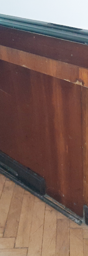
- rozměry a profilace dtto obklad v předsálí